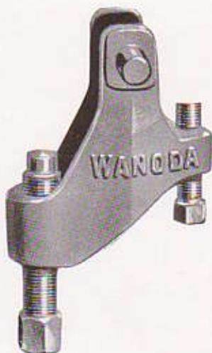
N° 117 - TIRE-PIVOT inférieur