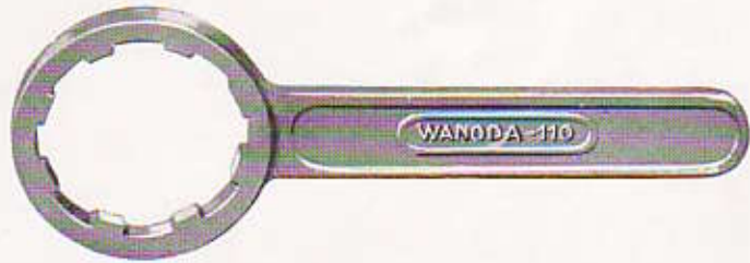
N° 113 - TIRE-ROTULE de direction