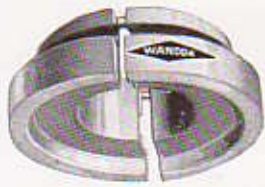
N° 107 - COQUILLE pour 1 er roulement de fusée