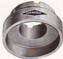
N° 108 - BAGUE pour moyeux AR