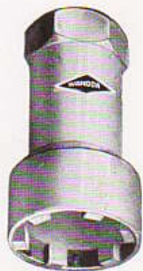
N° 111 - CLÉ pour Erou de 2 e roulement