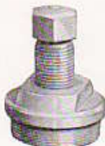
N° 116 - TIRE-PIVOT supérieur